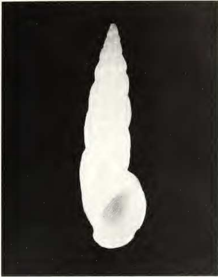
Fig. 3. Rissoa auriscalpium (Linnè, 1758) collezione Brunetti attuale Cala Ginepro (NU), Italia, H 8 mm.